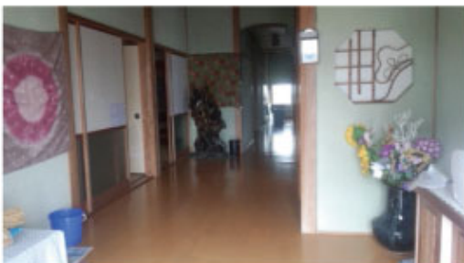
玄関から廊下を見る。左右に部屋。