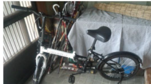
無償貸与の自転車