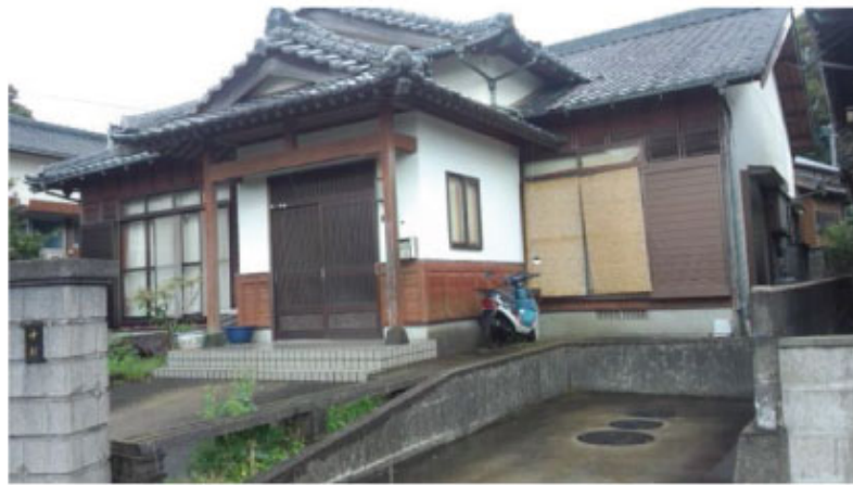
シェアハウス外観